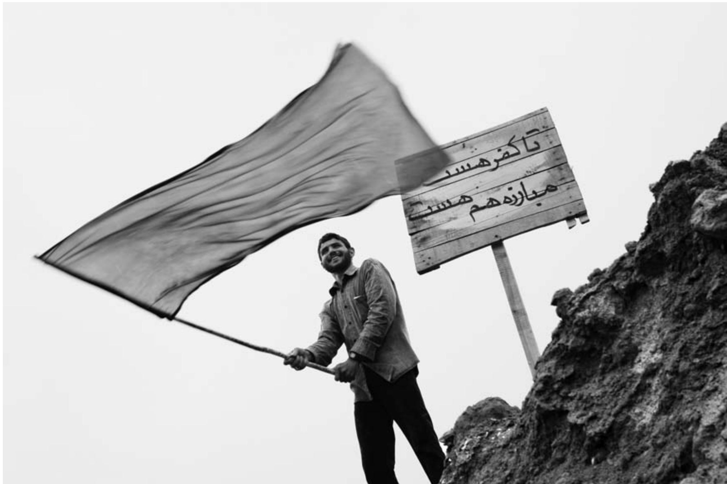
شلمچه، فروردین ۱۳۸۶. Shalamcheh, March 2007.