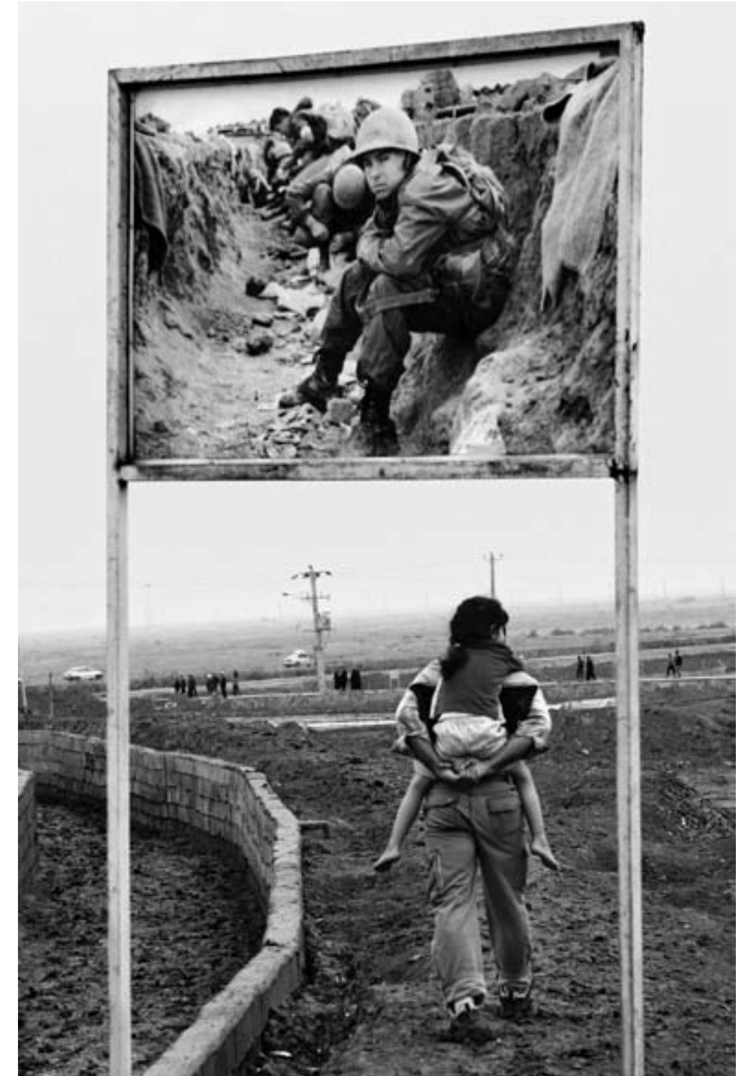
شلمچه، فروردین ۱۳۸۶ / گذشته و امروز شلمچه. Shalamcheh, March 2007/ Shalamcheh past and present.