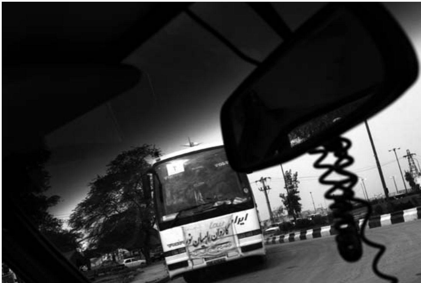
خرمشهر، فروردین ۱۳۸۶/ اتوبوس حامل زائرانِ خرمشهر وارد شهر شده است.