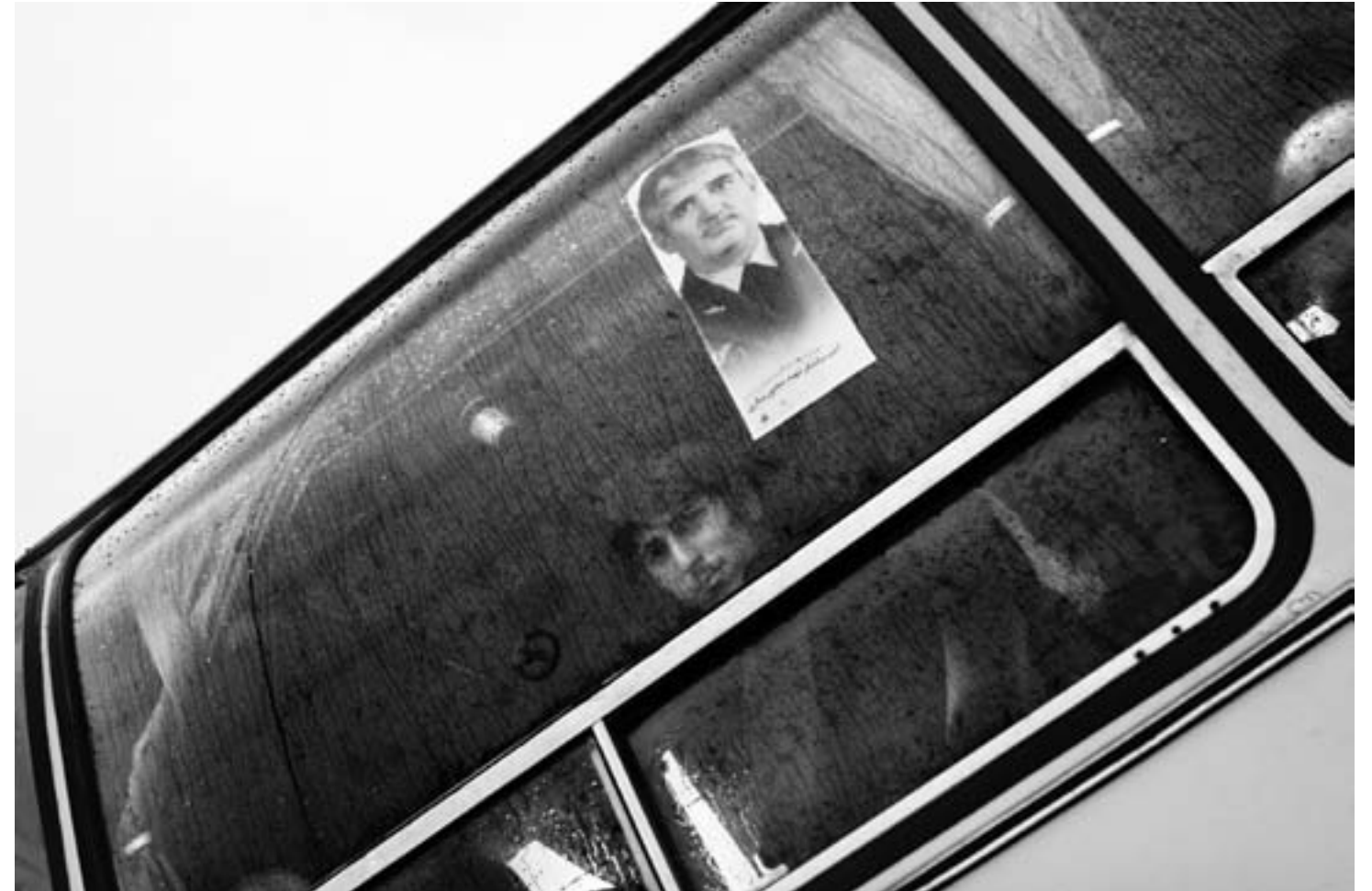
شلمچه، فروردین ۱۳۸۶ با وجود بارش باران شدید، مردم برای زیارت آمده‌اند.

The graves of unknown martyrs, Shalamcheh, March 2007.