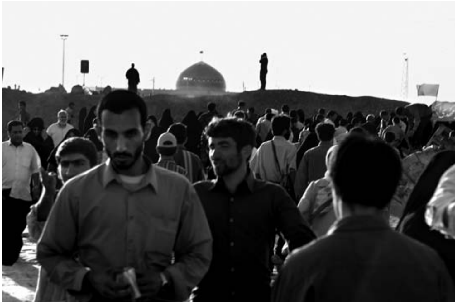
مقبره شهیدای گمنام، شلمچه، فروردین ۱۳۸۶.

The graves of unknown martyrs, Shalamcheh, March 2007.