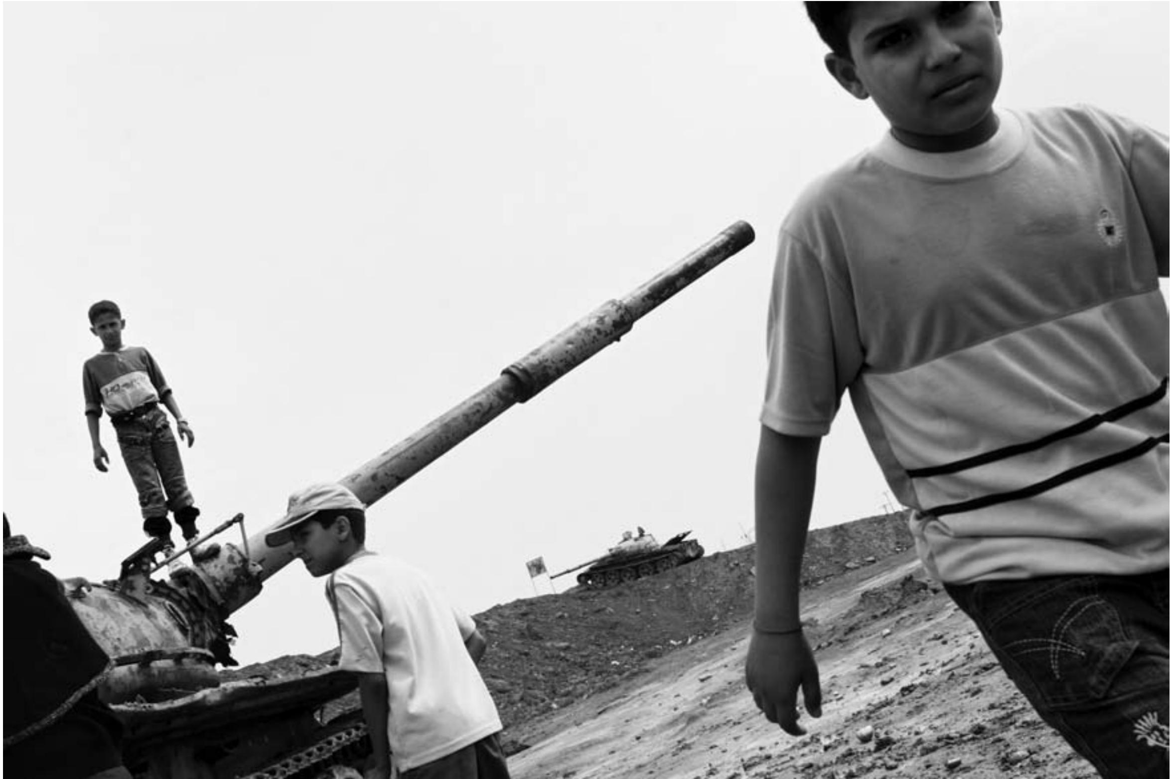
شلمچه، فروردین ۱۳۸۶ / بازی کودکان با ادوات جنگی بجا مانده از ارتش عراق.