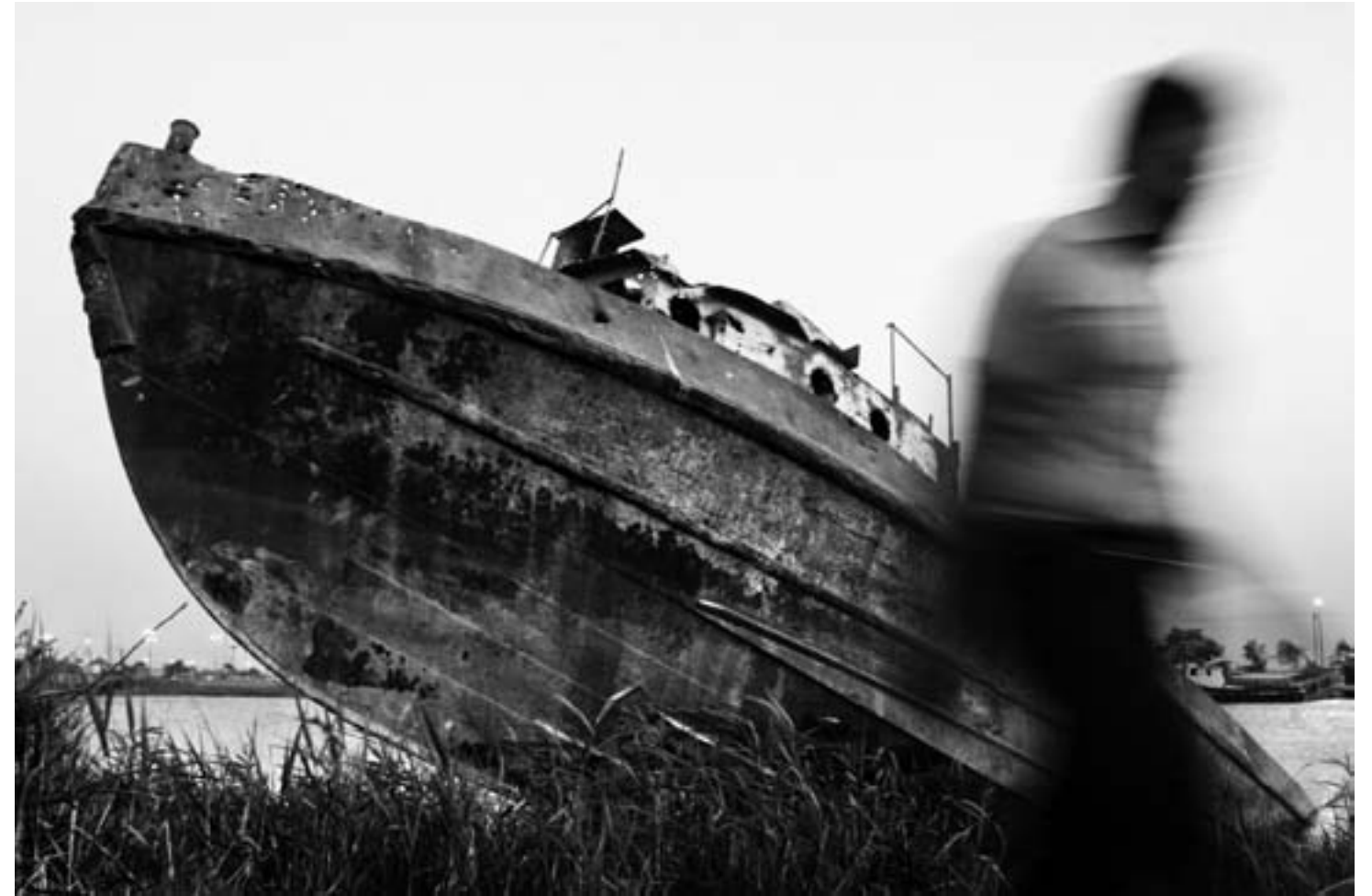
خرمشهر، فروردین ۱۳۸۶ / لنج آسیب دیده از حملات نیروهای عراقی، سال هاست که در ساحل رود کارون به گل نشسته است.