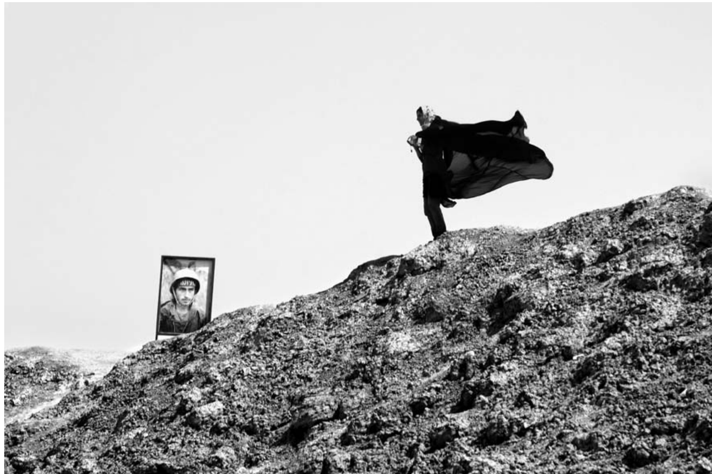
شلمچه، فروردین ۱۳۸۶. Shalamcheh, March 2007.