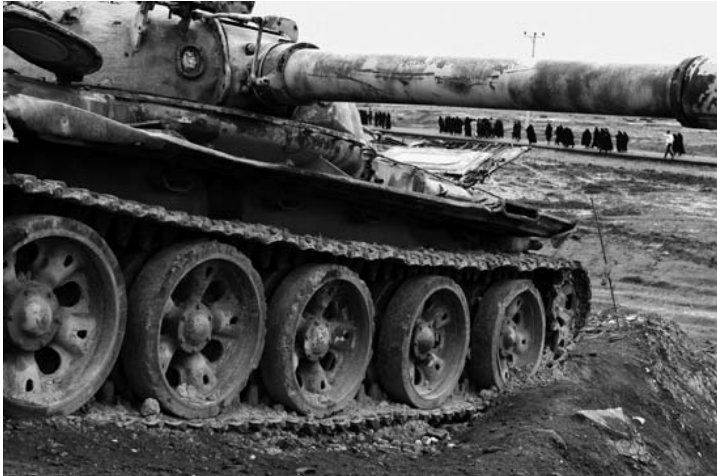
شلمچه، فروردین ۱۳۸۶. Shalamcheh, March 2007.