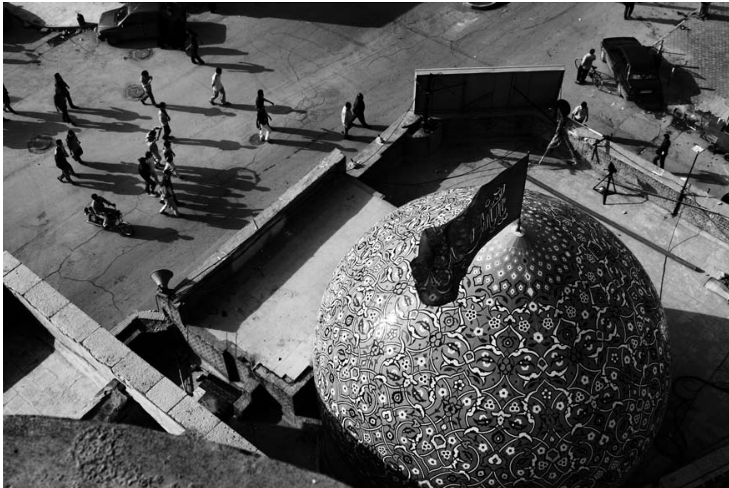
مسجد جامع، خرمشهر، فروردین ۱۳۸۶ / زائران برای دیدار مسجد جامع، سمبل مقاومت شهر خرمشهر به سمت آن می‌روند.