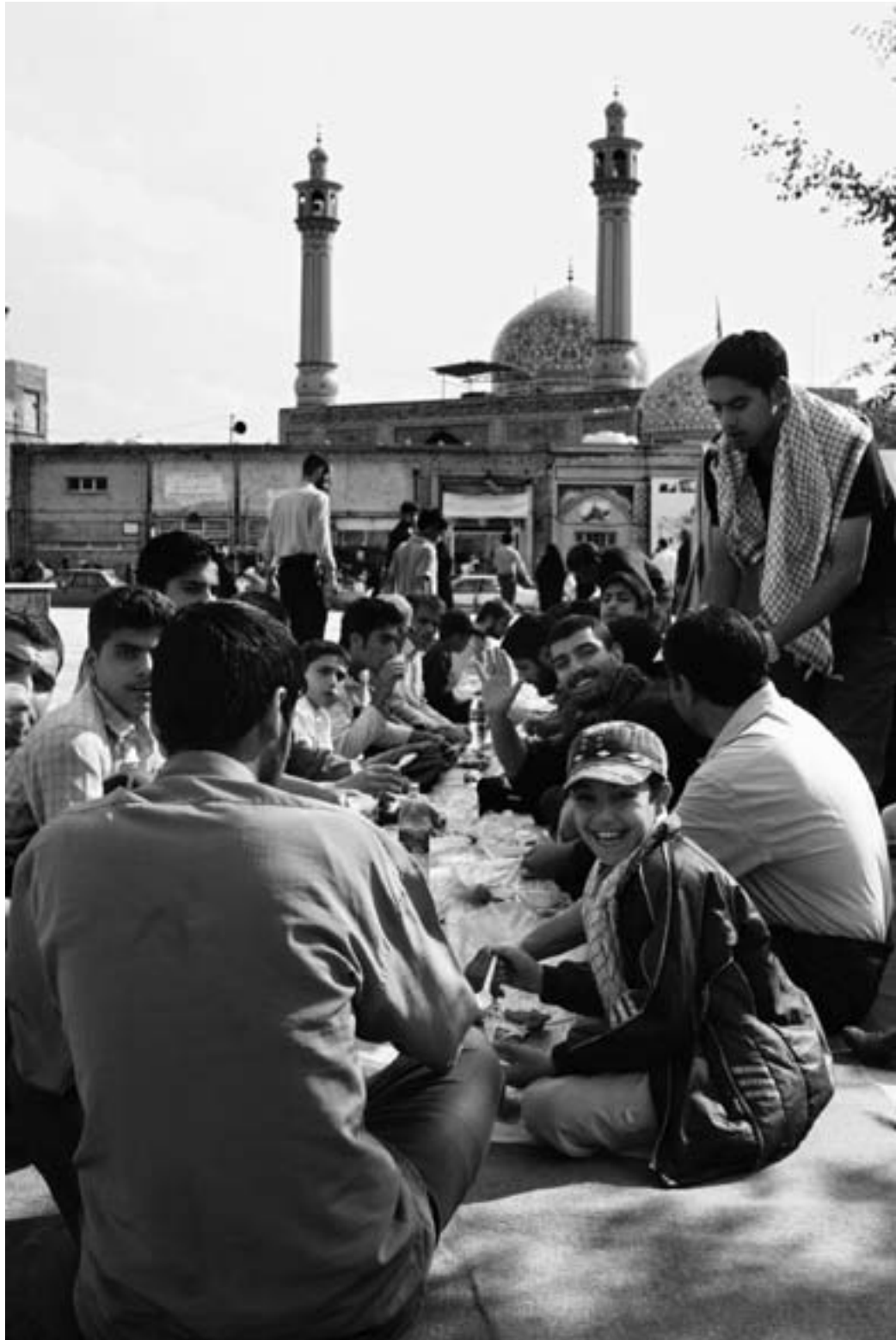
اطراف مسجد جامع، خرمشهر، فروردین ۱۳۸۶ / صرف ناهار پس از زیارت مسجد.

Around Congregational Mosque, Khoramshahr, March 2007 / Lunch spread after the visit to the Mosque.