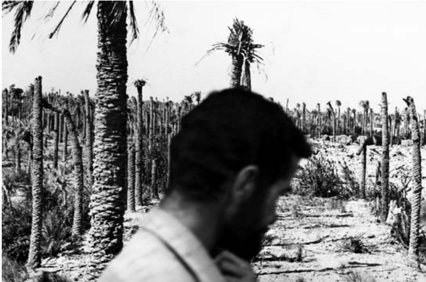
موزه مقاومت، خرمشهر، فروردین ۱۳۸۶.

Museum of Resistance, Khoramshahr, March 2007.